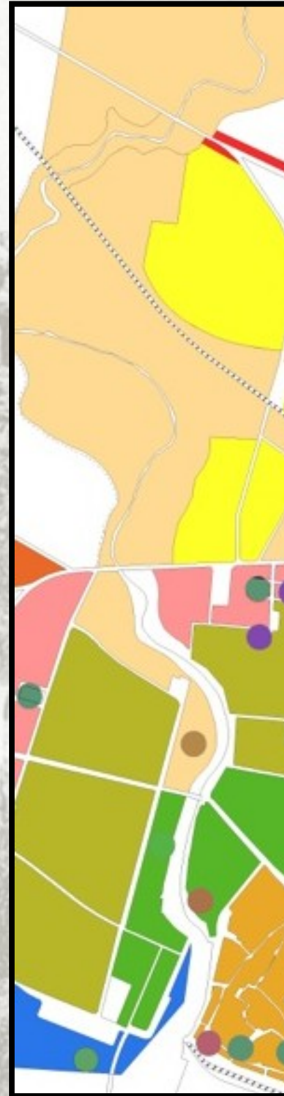
Variante Mastolilli 1972

zona C5 Preferenziale per pubbliche attrezzature