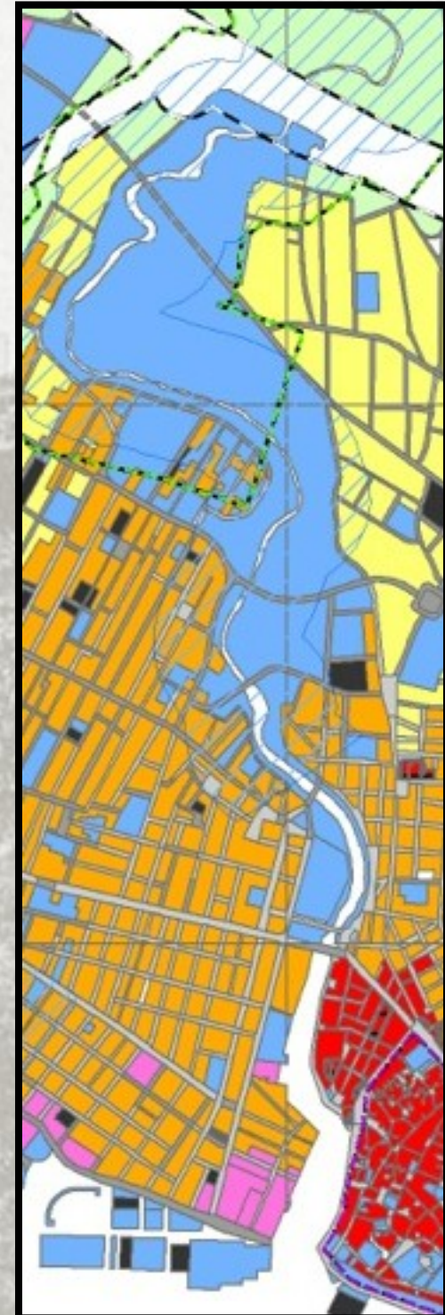
Di Cristina 2003